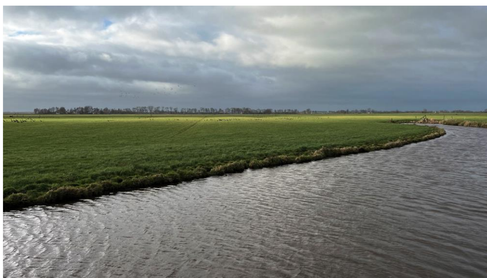
Jacobs bedrijf ligt in watersysteem Poppenhuizen in ADD-Noord.

Aldeboarn-De Deelen (5000ha / 70 agrarische bedrijven) is centraal gelegen in Friesland, in de gemeenten Heerenveen, Smallingerland en Opsterland. Het gebiedsproces is in 2017 gestart op initiatief van burgers en boeren.